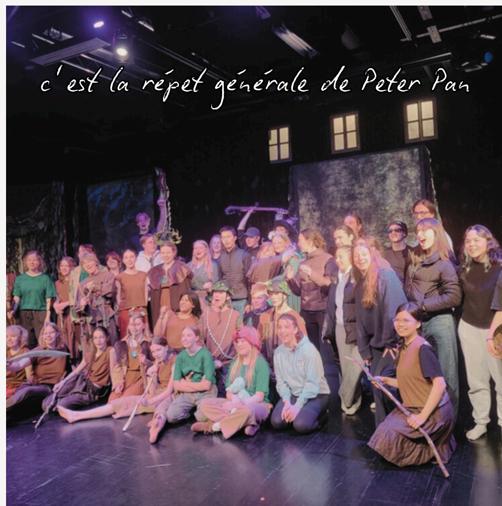
c'est la répet générale de Peter Pan