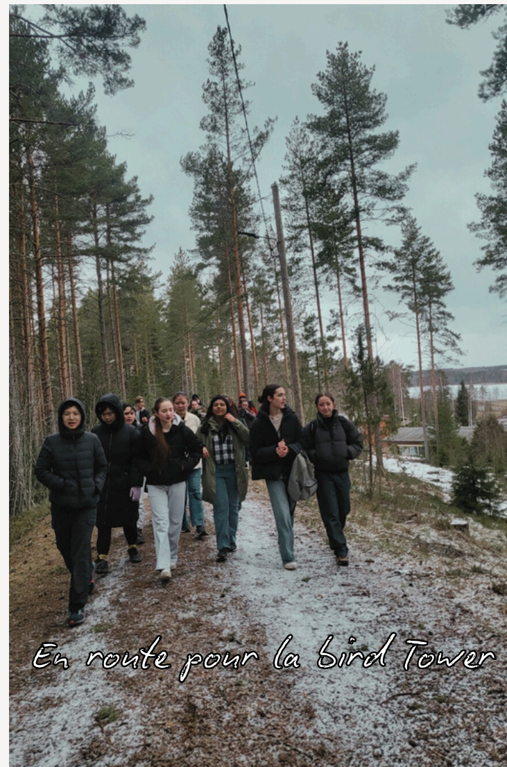
En route pour la Bird Tower