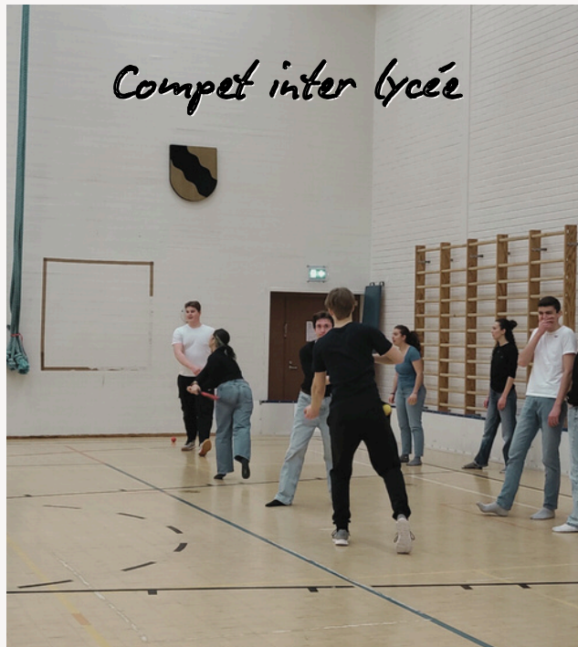
Compét inter lycée