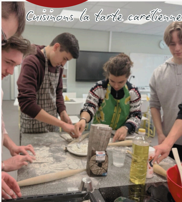
Cuisinons la tarte carélienne