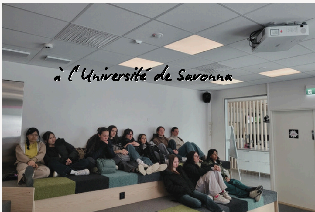
à l'Université de Savonia

12 élèves de VH 1 semaine dans la vie de lycéens finlandais