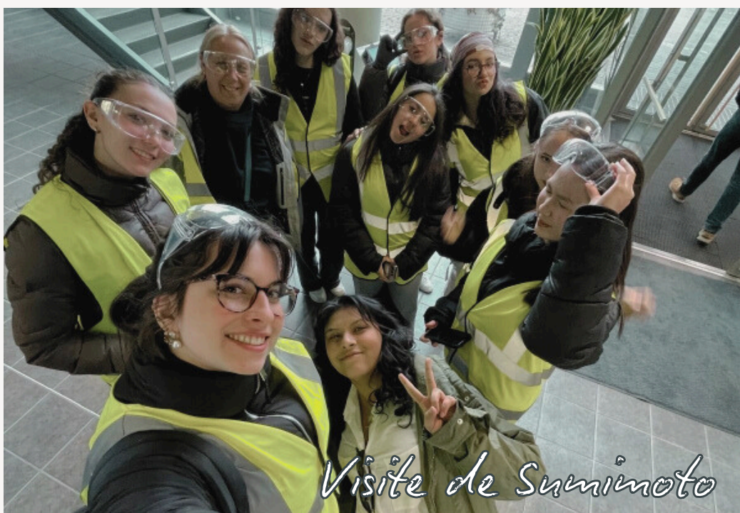
Visite de Sumimoto